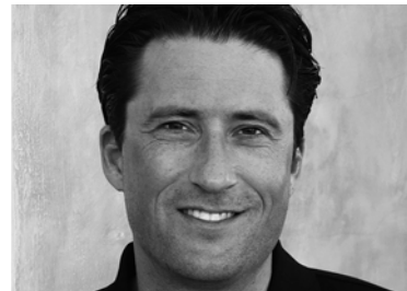
Delegierter des Verwaltungsrates